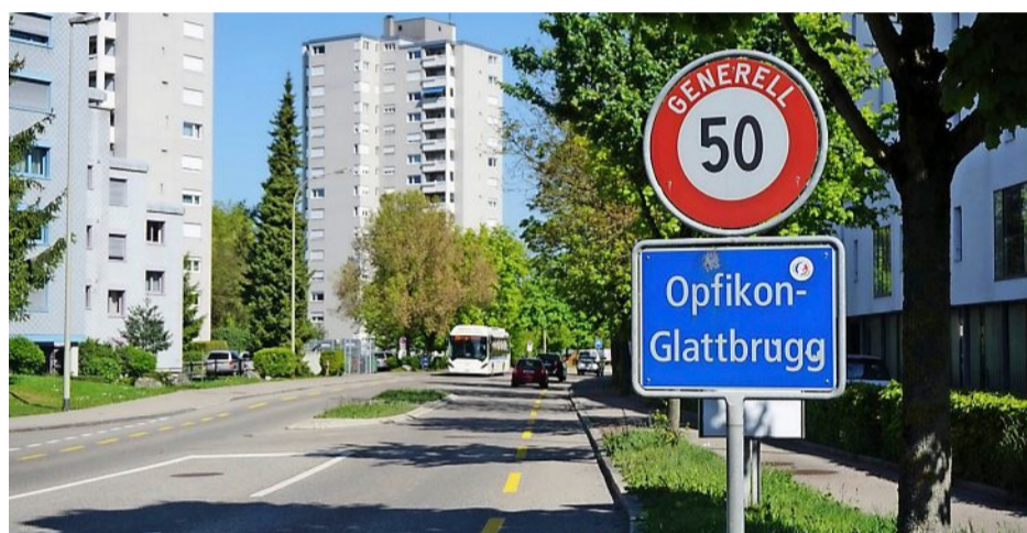
In Dägerlen ist die Demokratie breit abgestützt: 36,3 Prozent der Bevölkerung machten bei den letzten Wahlen mit. In Opfikon waren es nur 9,1 Prozent.